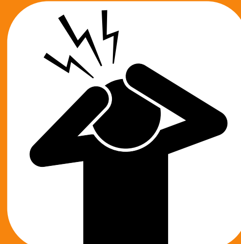
Maumivu ya kichwa