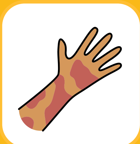
Vipele vinavyotokana na joto