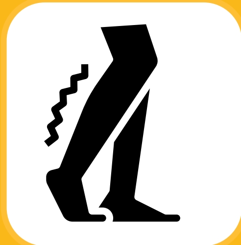
Maumivu ya misuli