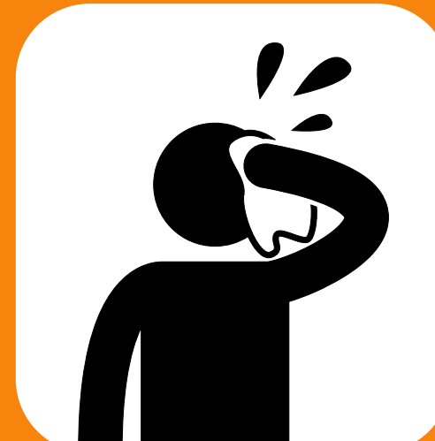
Kutokwa na jasho jingi