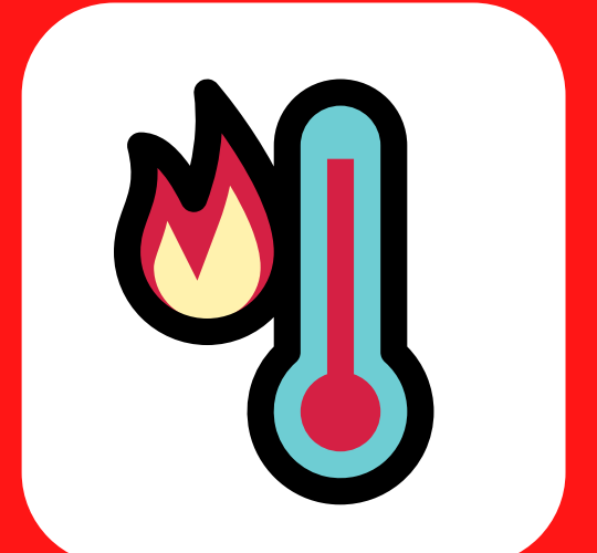
Halijoto ya juu ya mwili