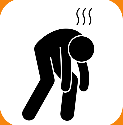
Udhaifu wa mwili