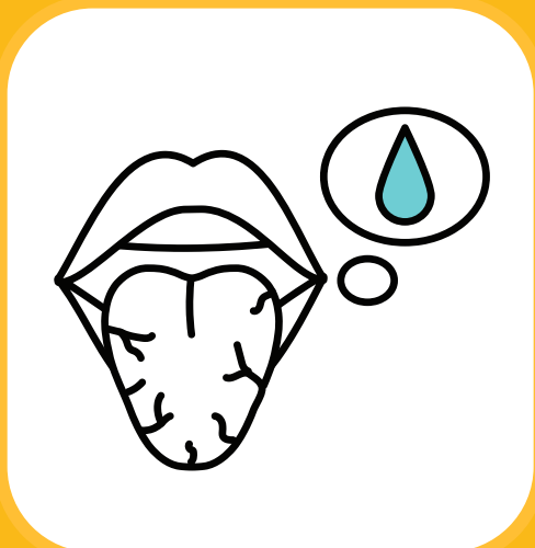
Kuishiwa maji (Kuhisi kiu)