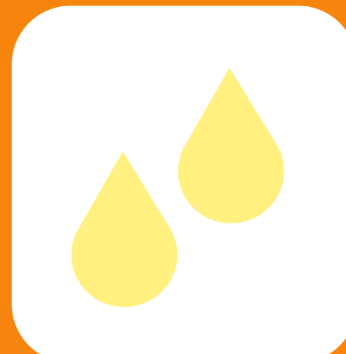
Kiwango kidogo cha mkojo