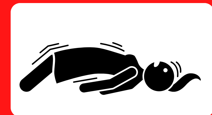
Matukutiko ya maungo

Magonjwa yanayotokana na joto huwa mabaya zaidi upesi. Kuwa mwangalifu na kushughulikia haraka dalili za mapema za mfadhaiko unaotokana na joto. Pigia 911 mara moja ikiwa mtu ana dalili za kuishiwa nguvu kutokana na joto au kiharusi kinachotokana na joto.