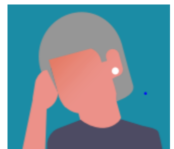
Dolor de cabeza