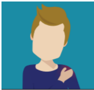
Dolor y hinchazón del brazo