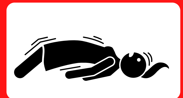
တက်ခြင်း

အပူကြောင့်နာမကျန်းမှု လျင်မြန်စွာ ပိုဆိုးလာသည်။ အပူကြောင့် ကြောင့်ကြမိစီးမှု၏ အစောပိုင်းလက္ခဏာများကို စောင့်ကြည့်ကာ အလျင်အမြန် တုံ့ပြန်လုပ်ဆောင်ပါ။ တစ်စုံတစ်ဦးတွင် အပူကြောင့် မောပန်းနွမ်းလျမှု သို့မဟုတ် အပူရှုပ်ခြင်း လက္ခဏာများရှိနေပါက 911 ထံ ချက်ခြင်း ဖုန်းခေါ်ဆိုပါ။