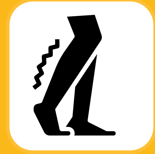
ကြွက်တက်ခြင်းများ