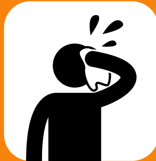
ချွေးအလွန်အမင်း ထွက်ခြင်း