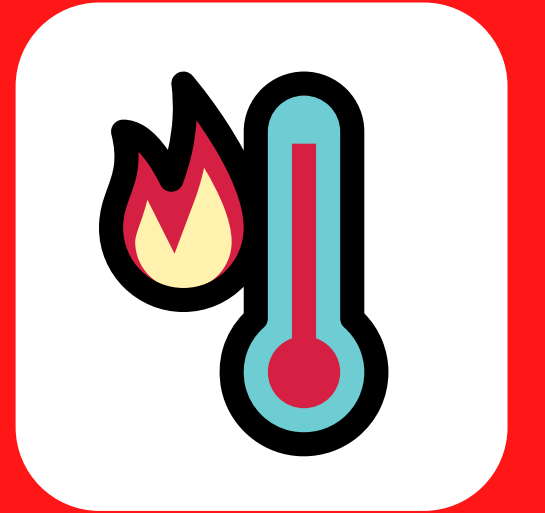
ကိုယ်အပူချိန် မြင့်တက်ခြင်း