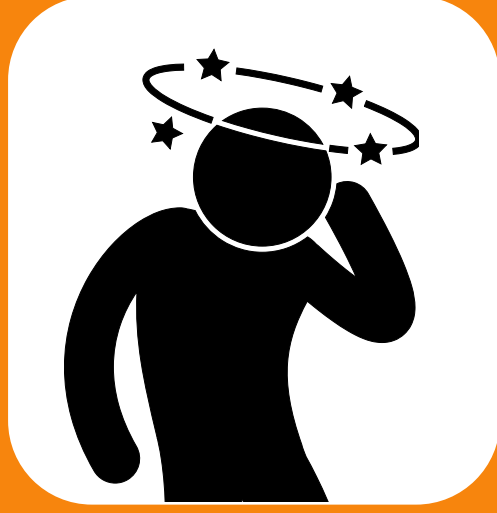
မူးဝေခြင်း