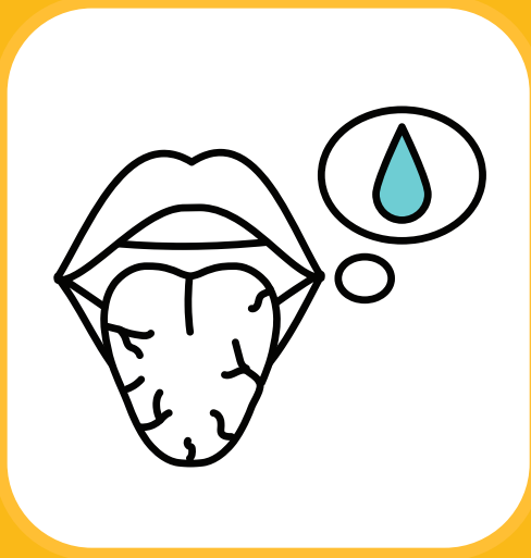
ရေဓာတ်ခမ်းခြောက်ခြင်း (ရေငတ်နေခြင်း)