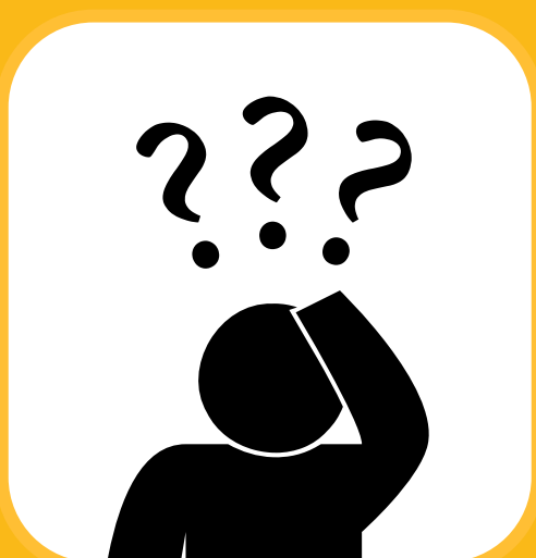
မရေရာမသေချာခြင်း