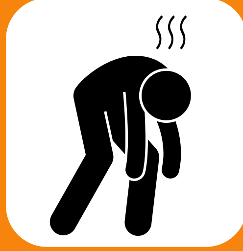
အားနည်းခြင်း