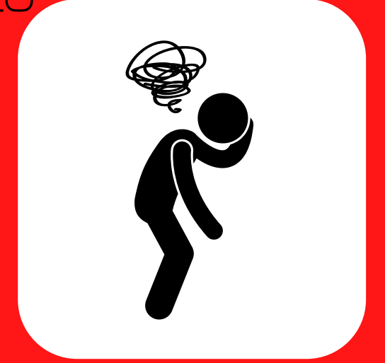
မရေရာမသေချာခြင်း