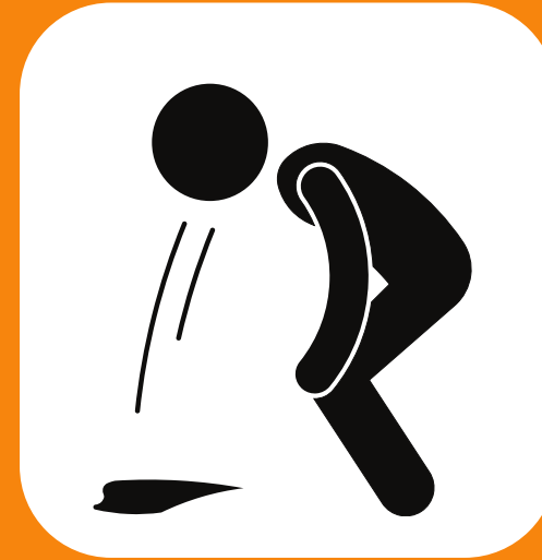
မအီမသာဖြစ်ခြင်း