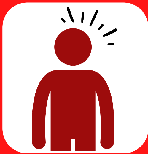
پوست قرمز، داغ، خشک