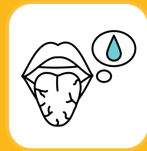
کم آبی بدن (تشنه بودن)